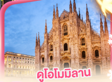
ดูไอโมมิลาน