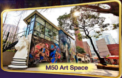
M50 Art Space