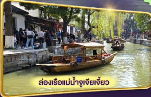
ล่องเรือแม่น้ำจูเจียงเจี๋ย