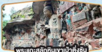
พระแกะสลักหินเขาเป่าต้งซัน