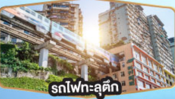
รถไฟฟ้าชุกติ