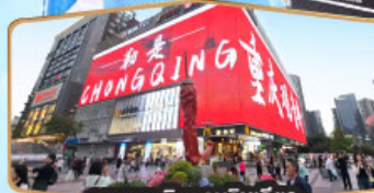
ถนนคนเดินทงวนฉีเจียว