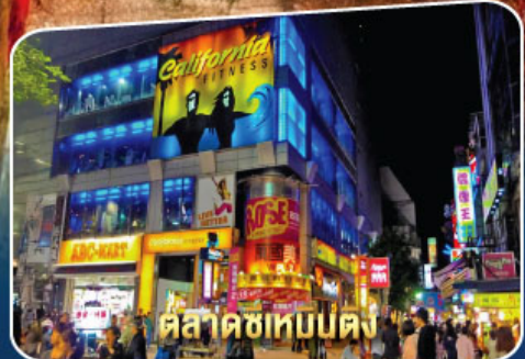
ตลาดซีเหมินตง