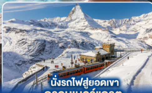
นั่งรถไฟสู่ยอดเขา กรอนเนอร์แกรต