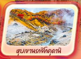
เขมเขานรกจิโศดธานี