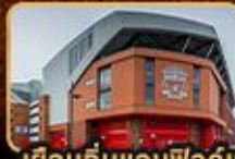
เยือนต้นแอนฟิลด์และโอลด์แทรฟฟอร์ด