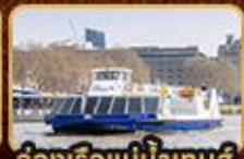
สองเรือแม่น้ำเทมส์