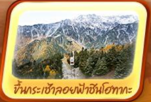
ขึ้นกระเช้าลอยฟ้าชินโงทากะ