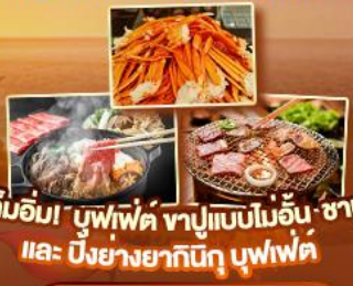
เค็มอิม่า บุฟเฟ่ต์ ซาปูแบบโมอิน ซาปู และ บิงย่างยากินิคุ บุฟเฟ่ต์

สัมผัสความเป็นญี่ปุ่น ชมวิวฟูจิ ครบทุกไฮไลท์เด่นๆ ห้ามพลาด ขึ้นดาตั้นใจกับหมู่บ้านมรดกโลกหมู่บ้านชิราคาวาโกะ ขึ้นกระเช้าลอยฟ้าชินโงทากะ ป้อนนมเขมเบ็น้องทวาง นารา ขอพรวัดโทไดจิ เช็กอินปราสาทโอซาก้า วัดคิโยมิสึดะระ ถ่ายรูปทำซูมิมือสุดฮิต ป้ายกุกิโกะ ปราสาทนัตสึโมโด้ ทะเลสาบชูวะ ขึ้นชมศาลเจ้าฟูจิซังเซเมงง หมู่บ้านน้ำใสโอฮิโนะฮักโก ปิดท้ายช้อปปิ้งย่านดัง ชินจูกุ