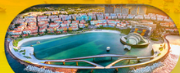
Kiss Bridge สะพานจูบ รวมค่าเข้าสะพานจูบแล้ว