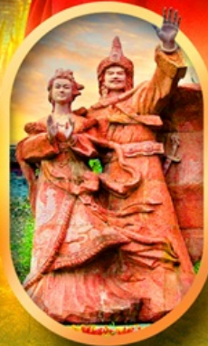
เมืองโบราณชงวาน