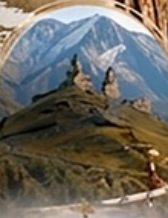
คาสเบกี 4WD EXPERIENCE