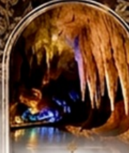
ดำโพรมิริอัส BOAT RIDE

เดินทางช่วงปีใหม่ 27 ธ.ค. - 3 ม.ค. 70 ราคาเพียง 75,989 บาท / ท่าน