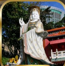
วัดเจ้าแม่กวนอิม สวีตเดีย