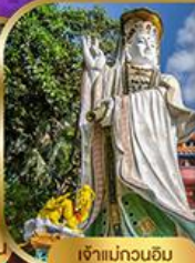
เจ้าแม่กวนอิม สวีลิสเบย์