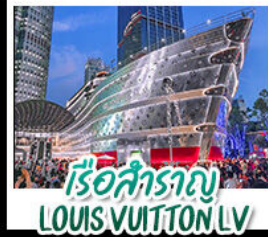
เรือสำราญ LOUIS VUITTON LV