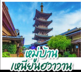
หมู่บ้านเหนียนฮวาวาน