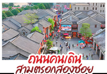
ถนนคนเดินสามตรอกสองซอย