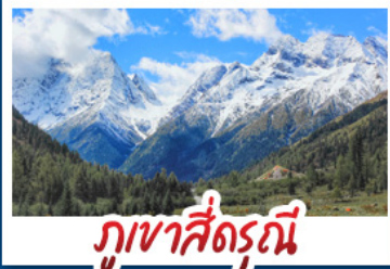
กุหลาบสี่ดรุณี

จิวจ้ายโกว - กุหลาบสี่ดรุณี - ปี้ฝิงโกว สวนดอกไม้บ้านฮวา - ถนนโกกู่หลี่ - ถนนคนเดินซุนซีลู่ ถนนโบราณชอยกว้างชอยแคบ - เมฆพิเศษ!!! สุกี่หม่าล่าเสฉวน