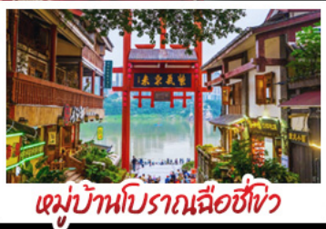
หมู่บ้านโบราณฉือชี่ไว