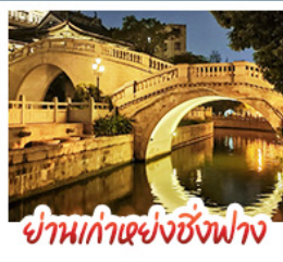
ย่านเก่าแห่งซิงฟาง