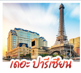
เดอะ ปารีส

สัมผัสบรรยากาศ เดอะ เวเนเซียน มาเก๊า เสมือนได้เยือนลาสเวกัส ชมความวิจิตรตระการตาของพระราชวังหยวนหมิงหยวนใหม่แห่งจูไห่ เช็กอินกับแลนด์มาร์กสุดฮิตจตุรัสสวาเอ็งถ่ายรูปลูกับหอคิวของกวางเจา เที่ยวชมหมู่บ้านสไตล์ยุโรปแห่งใหม่ของเซินจิน • ช้อปปิ้งเพลิน ๆ ที่ห้างสรรพสินค้า COCO PARK ถนนคนเดินฟู้หว้อลี่และถนนคนเดินบิกกิง