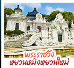
พระราชวัง เฉียนเหมิงเฉียนเหมิง