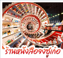
ร้านหนังสือจุงชูก่อ