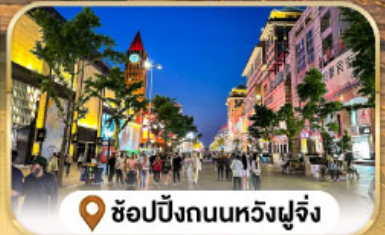
ช้อปปิ้งถนนหวังฝูจิ้ง