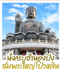
นั่งกระเช้ามองปิง ชมพระใหญ่ไผ่หลิน

นั่งกระเช้ามองปิงสักการะพระใหญ่ไผ่หลิน • วัดหวังต้าเซียน ขอพรสุขภาพ ความรัก วัดเข่งหมิว ขอพรองค์เซกุง โชคลาภ การเงินและธุรกิจ • เจ้าแม่กวนอิมรัฟัสส์เบย์ รับพลังงานดี เสริมพลังฮวงจุ้ย • วัดหมิ่นโหมว ขอพรเรื่องการศึกษ การงาน สติปัญญาและความกล้าหาญ