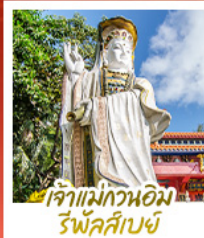
เจ้าแม่กวนอิมรัฟัสส์เบย์