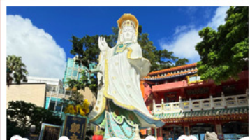
เจ้าแม่กวนอิมรัฟส์เบย์