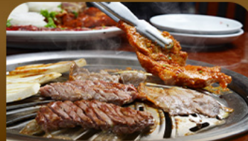
เมนูช่างสไตล์เกาหลี