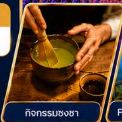
กิจกรรมชงชา