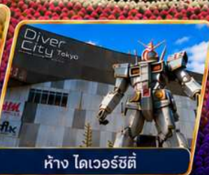
ห้าง ไดเวอร์ซิตี