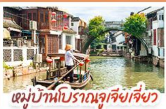
หมู่บ้านโบราณซูเจียงเจียงว

สวนสนุกเซี่ยงไฮ้ดิสนีย์แลนด์ เต็มวัน (รวมรถรับ-ส่ง)