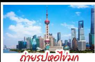
ถ่ายรูปหอไข่มุก