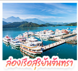
ล่องเรือสุริยันจันทร์