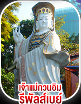
เจ้าแม่กวนอิมรีฟลัสส์เบย์