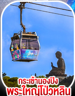
กระเช้าองปิงพระใหญ่ไผ่หวลีน