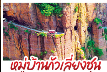
หมู่บ้านทิวลิ้งชุน