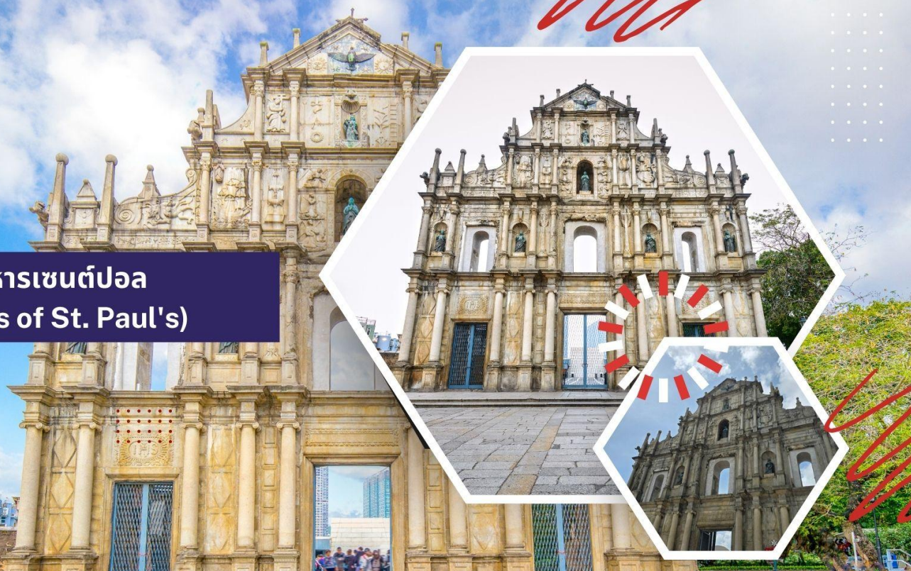
วิหารเซนต์ปอล (Ruins of St. Paul's)

นำท่านเดินทางสู่ นำท่านเดินทางสู่ มาเก๊า (ในการเดินทางข้ามด่าน ท่านจะต้องลากกระเป๋าสัมภาระของท่านเอง และผ่านพิธีการตรวจคนเข้าเมืองใช้เวลาในการเดินประมาณ 45-60 นาที) ในอดีตมาเก๊าเป็นเพียงแค่มุมบ้านเกษตรกรรมและประมงเล็กๆ ซึ่งเป็นเมืองที่มีประวัติศาสตร์ยาวนาน โดยมีชาวจีนกวางตุ้งและฟูเจี้ยนเป็นชนชาติดั้งเดิม จนมาถึงช่วงต้นศตวรรษที่ 16 ชาวโปรตุเกสได้เดินเรือเข้ามายังคาบสมุทรแถบนี้เพื่อติดต่อค้าขายกับชาวจีนและมาสร้างอาณานิคมอยู่ในแถบนี้ ที่สำคัญคือ ชาวโปรตุเกสได้นำพาเอาความเจริญรุ่งเรืองทางด้านสถาปัตยกรรมและศิลปวัฒนธรรมของชาติตะวันตกเข้ามาอย่างมากมาย ทำให้มาเก๊ากลายเป็นเมืองที่มีการผสมผสานระหว่างวัฒนธรรมตะวันออกและตะวันตกอย่างลงตัว