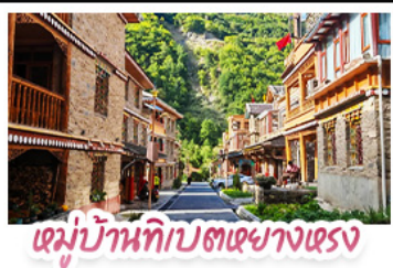
หมู่บ้านทิเบตสวยงามตรง

ตะลุยเจ็ดตุ๋น ต้ากู่ปิงชาน ชวนเซ็กคินแพนด้ายักษ์ พักใจที่หยดน้ำตาสีฟ้า! แวะชิลเมืองโบราณลั่วไต้ สัมผัสสมนต์เสน่ห์ หมู่บ้านทิเบตหยางหงซาต่อ สัมผัสความหนาวเย็นที่ อู๋ชานสวรรค์ธารน้ำแข็งต้ากู่ปิงชาน แหล่งรวมวิวหลักล้าน ตื่นตาไปกับแสงสียามค่ำคืน หยดน้ำตาสีฟ้า ณ สะพานหนานเฉียว เมืองตุ๋นเจียงเจียง ก่อนปิดท้ายด้วยการช้อปปิ้งจุใจ ถนนชุนซีลู่-ไท่กู่หลี่ และเซะภาพกับ แพนด้าเซลฟี สุดคิวท์