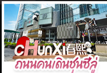
ชุนซีลู่ 春熙路 ถนนคนเดินชุนซีลู่