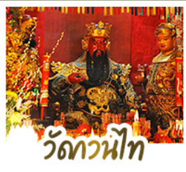
วัดกวนหน้้ท