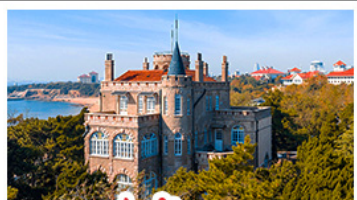
ป่าด้ากวน

พระราชวังฤดูร้อน - วิวเมืองชิงเต่า รถไฟความเร็วสูง - ภูเขาเหลาซาน กำแพงเมืองจินด่านจวิยงกวน - ป่าด้ากวน พักโรงแรมระดับ 4 ดาว - ไม่หลงร้านช้อปปิ้ง มือพิเศษ เปิดปักกิ่ง , หม้อไฟซีฟู้ด