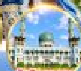
มัสยิดหลวง