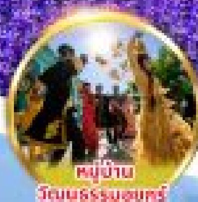
หมู่บ้าน วัฒนธรรมอูรุมชี

พิเศษ! อูรุมชี + ดินแดนซินเจียง รวมกันแล้ว