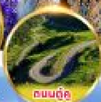
ถนนคู่ใจ