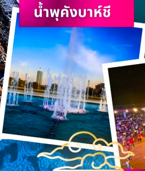
น้ำพุคังบาชี