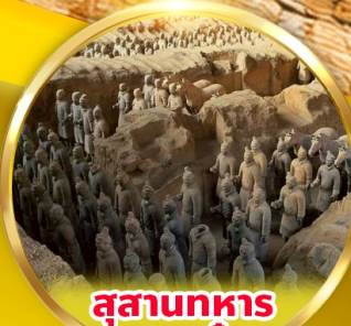
สุสานทหารดินเผาจีนซี