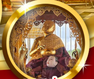
พระอุปคุต