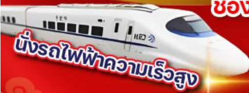
บั้งรถไฟฟ้าความเร็วสูง