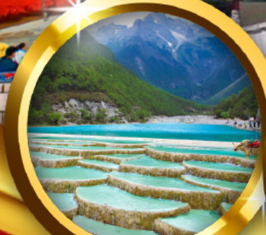
ทะเลสาบไ้สุยเห่อ