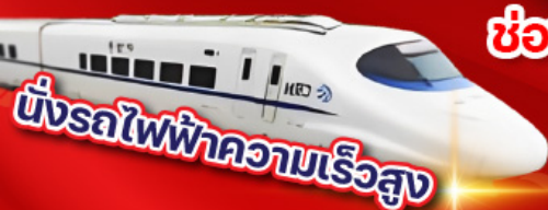
นั่งรถไฟฟ้าความเร็วสูง