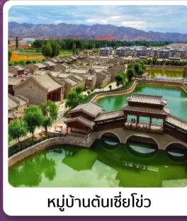
หมู่บ้านตันเซี่ยโซ่ว