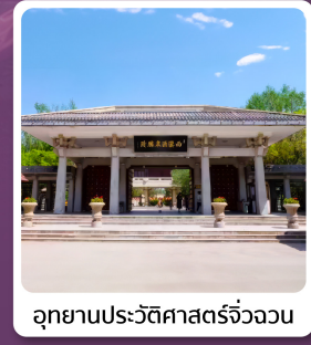
อุทยานประวัติศาสตร์จิวจวง

อาหารมื้อพิเศษ ใต้ต้นหม้อไอน้ำ ซีโครงหมูสัโถลิกันโจว