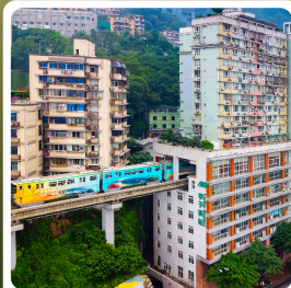
รถไฟฟ้าตึก