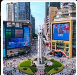
ถนนเจียฟางเปี่ย