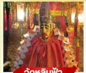
วัดหลิมฟ้า