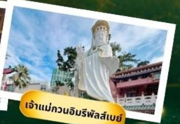
เจ้าแม่กวนอิมริฟัสเบย์