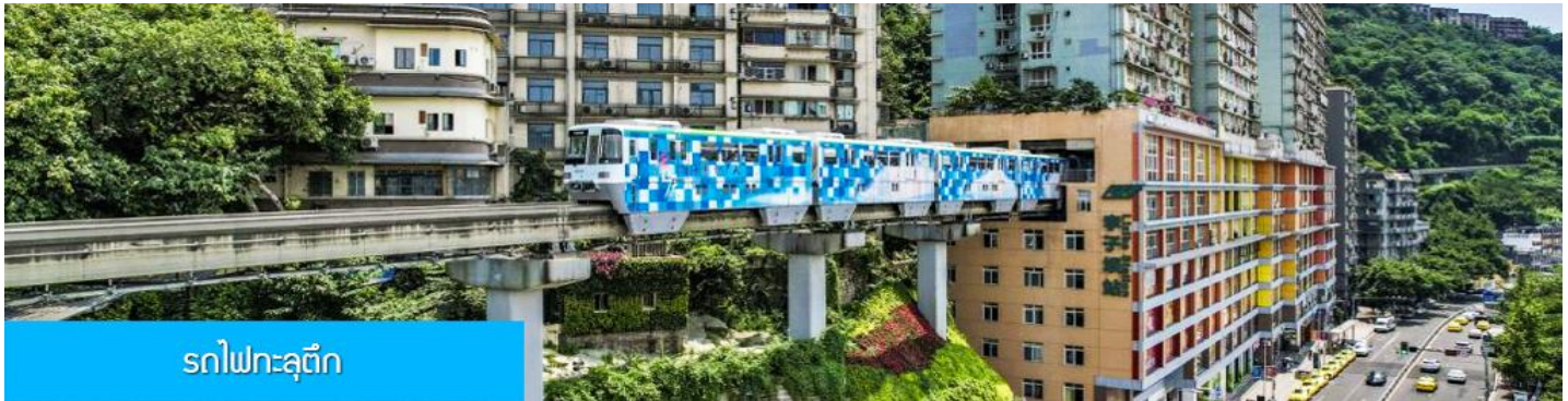
รถไฟทะเลวูตีก

พักที่ HOLIDAY INN EXPRESS HOTEL โรงแรมระดับ 4 ดาวหรือเทียบเท่า เมืองจงชิ่ง