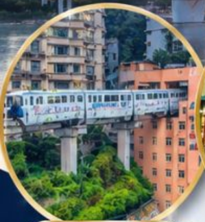
รถไฟทะลุตึก Liziba Station