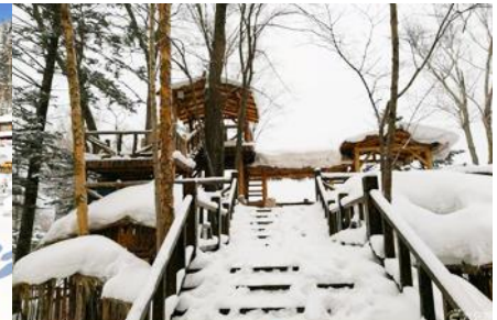
ระเบียงชมวิวปีงจฺยฺซาน

วันที่สาม เมืองฮาร์บิน-สถานีรถไฟยาบูลี-รวมนั่งม้าลากเลื่อน- หมู่บ้านหิมะ Xue xiang China Snow Town - ระเบียงชมวิว เขาปีงจฺยฺซาน- ชมแสงสียามราตรีหมู่บ้านหิมะ-ชมพลุไฟและขบวนพาเหรดระบำพื้นเมือง-นอนในหมู่บ้านหิมะ Xue xiang