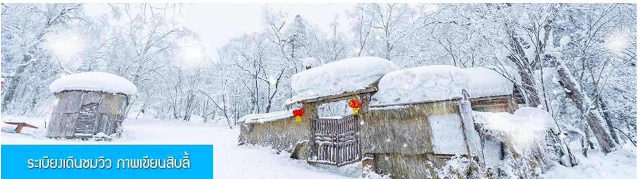
ระเบียบเดินชมวิว ภาพเขียนสิบลี่