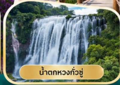
น้ำตกหวงกั๋วชู่