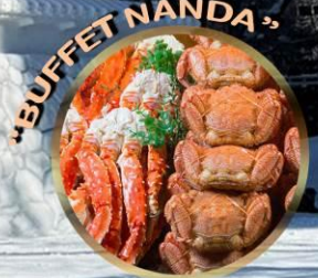
LAKE SHIKOTSU ICE FEST 2027