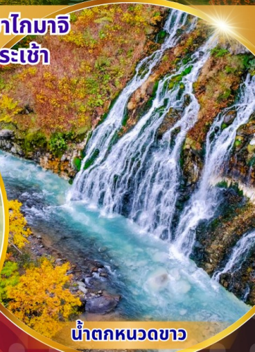
น้ำตกหมวดขาว