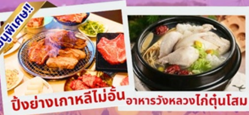
ปิ้งย่างเกาหลีไม่อื่น อาหารวังหลวงใต้ต้นไม้ม