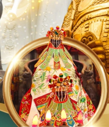
ขี้มเงินเจ้าแม่กวนอิมสองฮา