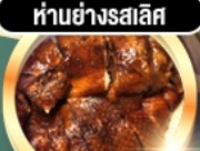
ห่านย่างสลีส