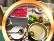
บุฟเฟ่ต์ชาบู เมียร์โมอัน!!